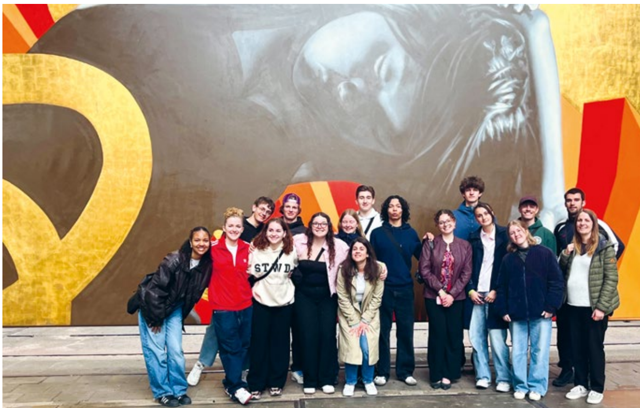
Musée du graffiti et de l'art de rue, STRAAT Museum, Amsterdam

« Ce voyage d'études nous a permis de cultiver des valeurs essentielles : l'amitié, le soutien, l'apprentissage, la réflexion et le partage. »