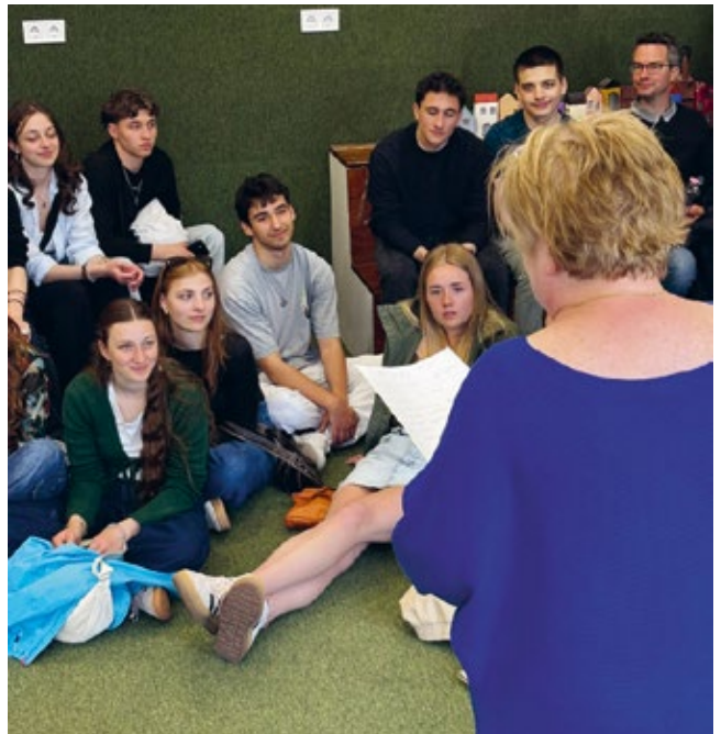
Zu Besuch in einer ungarischen Schule

Neben den unterhaltsamen Aktivitäten setzten wir uns auch intensiv mit politischen, historischen und gesellschaftlichen Themen auseinander. Beispielsweise haben wir ein Interview mit einem jungen Oppositionellen geführt und eine ungarische Privatschule besucht, was uns einen spannenden Einblick in ein anderes Bildungssystem ermöglichte.