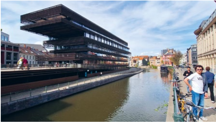
Die Bibliothek De Krook

Entre des musées retraçant l'histoire de la ville et un atelier de graffiti en périphérie, nous avons pu constater comment Gand conjugue avec harmonie tradition et innovation. Que ce soit lors des tours à vélo avec les locaux, des baignades au bord de l'eau ou des délicieux repas que nous partageons à table, une atmosphère chaleureuse régnait tout au long du séjour.