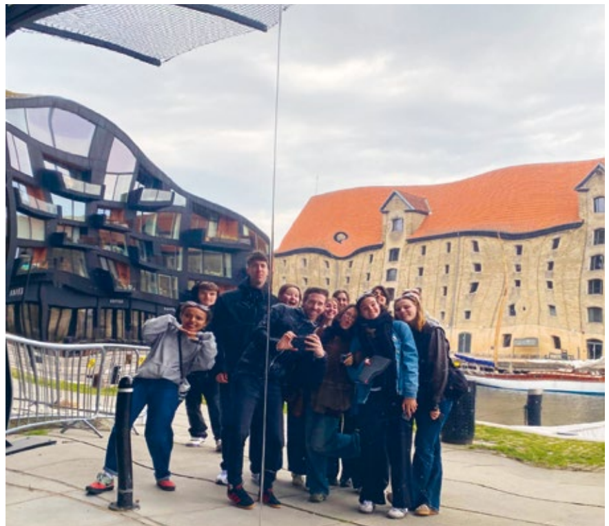
Ein Spiegel der Nachhaltigkeit: Die Klasse 3E2

uns niemand mehr von den Einheimischen unterscheiden.